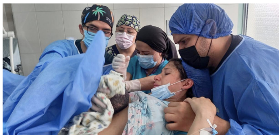
Fomento de la lactancia materna

Somos un Establecimiento Amigo de la Madre y el Niño.