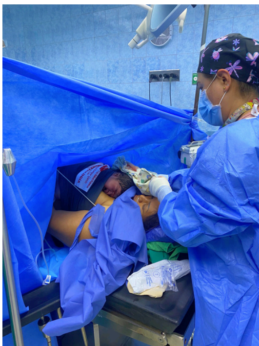
Apego materno temprano