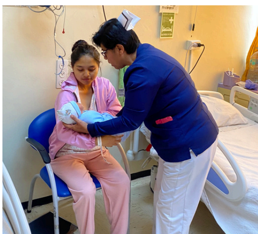
Atención adecuada del recién nacido